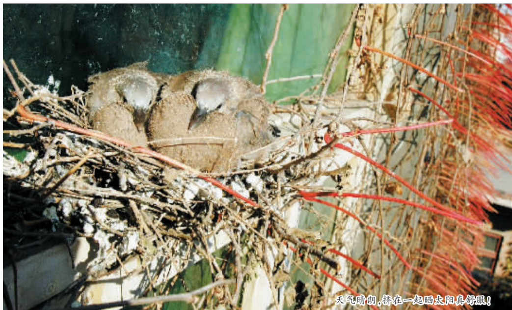
天气晴朗，挤在一起晒太阳真舒服!