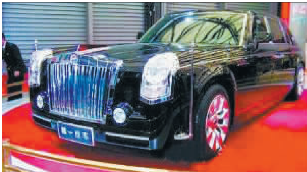
阅兵车为手工制“红旗”

国庆庆典的时间和地点毋庸置疑是10月1日上午10时、天安门广场。1984年和1999年的两次庆典都是在上午10时开始的,1999年庆典的开始由时任北京市委书记的贾庆林同志宣布。由此推断,这次的程序和开始时间也不会相差太多。距离上一次国庆阅兵已有10年,10年前的传媒业远没有今日的发达,大多数民众都是通过国庆当天电视直播和媒体随后的报道才逐步了解阅兵的情况的。10年后传媒业的迅猛发展,尤其是网络媒体的跃升,让几天后的国庆60周年阅兵已经清晰地展现在人们面前。