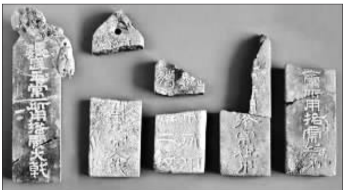
目前被认为是“最确切证据”的出土刻铭“魏武帝”石碑。(资料图片)

文物部门与地方政府在对待文物开发立场的不同，在许多地方都能见到。问题只是，以保护、研究为主的文物部门，真的能在未来“景区”的建设中当家吗？如果不能，大可不必轻率表态、承诺，否则只会徒然暴露政府部门间的不能