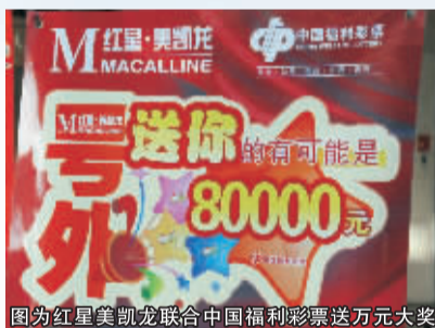
图为红星美凯龙联合中国福利彩票送万元大奖

国福利彩票隆重推出购物抽大奖活动。在商场消费满2000元的顾客都可获得福利彩票1张，虽然现在大奖还没有出炉，但是最高奖金达8万元的诱惑还是吸引了很多人的目光。