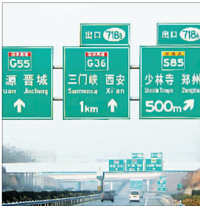
二广高速一处新指示标志牌。

记者了解到，在这次交通标志调整中，高速公路的指示标志有所增加，如在高速公路互通立交和收费站出入口新设方向标志，让司机不用导航仪就能知道自己的行驶方向。除增加了新的指示标志外，高速公路的出口编号也有所变化，新的出口编号采用里程桩（公里数牌）整数表示，当桩号值超过千位时，编号使用后三位，这样出行者根据目的地出口的编号数，并结合里程牌，就可估算出当前车位置距