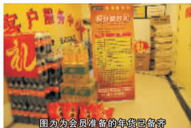
图为为会员准备的年货已备齐

新年还未到，红星美凯龙的新年大礼包就开始发放了。手持第三届万人团购会门票的消费者都可以到这里领取礼品。红彤彤的春联喜庆吉祥，制作精美的新年台历免费送，表达了红星美凯龙最真诚的心意。在3楼的客服中心，红星美凯龙的老顾客正聚在这里用积分兑换福临门食用油、大米、冰箱等丰富的年货。