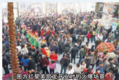
图为红星美凯龙开业时的火爆场景

作为洛阳规模最大、影响力最强的家居卖场之一，红星美凯龙始终心系广大消费者，此次为能够给即将到来的新年增添一些喜庆的气氛，带给消费者更多新年的喜悦，主办方用新年购物节这种方式送出了红星美凯龙最诚挚的新年祝福。