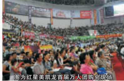
图为红星美凯龙首届万人团购会现场