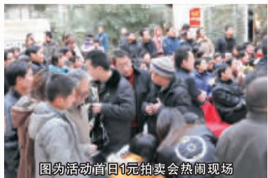
图为活动首日1元拍卖会热闹现场