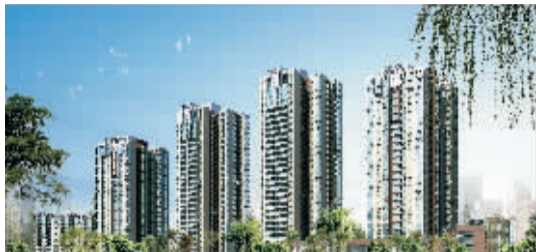
千年凤首地，引领人居典范

千年古城洛阳曾经流传过一个美丽的传说，远古时期，一只美丽的凤凰经过长途跋涉，饥渴难耐，终于发现了北依邙山、南傍洛水的洞天福地，便从邙山上俯冲而下，一头扎向洛河边，饮了个痛快。因此，古洛阳城被誉为“凤凰城”，而伸向洛水的凤化街便是凤首的化身。