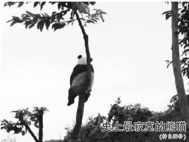
史上最寂寞的熊猫