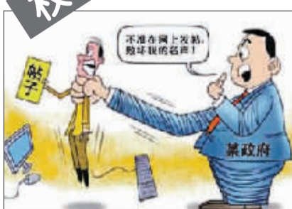
网络标签:“跨省抓捕”