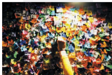
新年前夕,纽约时报广场咨询中心内专门设立了一面许愿墙,来自世界各地的游客可以将写有2010年美好心愿的五彩纸片贴到上面(如图)。

地时间2009年12月31日18时开始,来自世界各地的100万人将在现场迎接新年。德国著名歌星也将来现场助兴。午夜来临时刻,持续10分钟的焰火将把夜空装扮得璀璨耀眼。