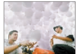
2009年12月30日,在巴西圣保罗,人们准备放飞气球,迎接新年。

德国人喜欢燃放烟花爆竹辞旧迎新。午夜12点,新年到来的时刻,家家户户都燃放焰火。此外,为迎接2010年,德国将在柏林勃兰登堡门举行盛大的迎新年晚会。晚会将于当