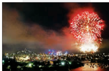
2009年12月31日,绚丽的烟花与悉尼湾大桥和悉尼歌剧院交相辉映。澳大利亚悉尼市当晚举行焰火表演,迎接新年。

这个水晶球灯将会被悬挂在旗杆上,直到午夜的60秒倒计时来临才被降下。纽约市市长迈克尔·布隆伯格将参与降灯仪式。