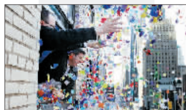
2009年12月29日,在美国纽约时报广场,志愿者将五彩许愿纸屑掷出窗外,进行迎新年狂欢活动预演。

英国爱丁堡的新年庆典2009年12月29日就已经开始,将持续至2010年1月2日,是欧洲最具特色的新年庆祝活动之一。29日,爱丁堡举行迎新年火炬大游行,31日在市中心举行的街道狂欢是整个庆典的高潮。只要花30美元,游客就可以欣赏3台音乐表演。从2010年1月1日开始,爱丁堡将被炫目的焰火笼罩。