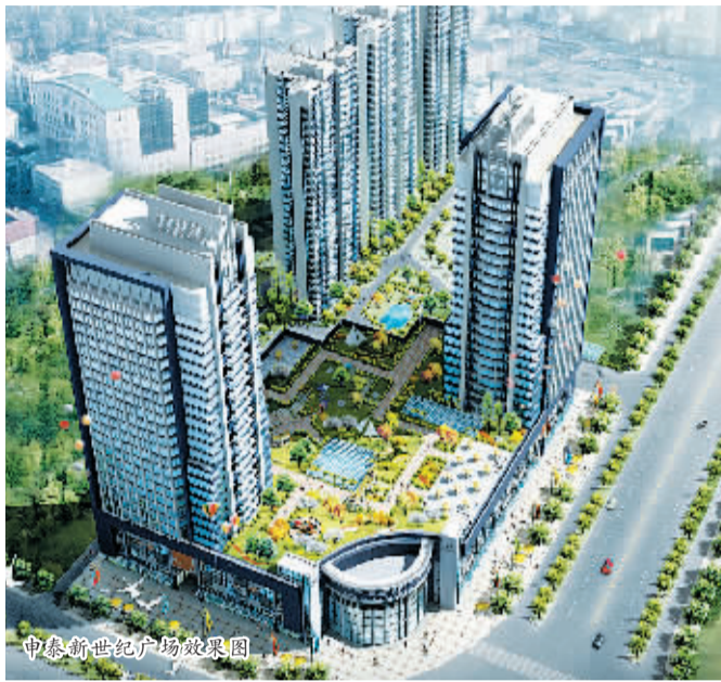
申泰新世纪广场效果图

而申泰新世纪广场项目的开发,则更加凸显出申泰置业独到的战略眼光,该项目位于王城大道与九都路交会处,这里不仅是洛阳市地理上的几何中心,更是洛阳市的交通中心和商业中心,是西工区最具发展潜力的核心地段,同时又是洛阳市新老城区最繁华的连接点,兼有大型传统专业建材商圈。按照整体规划设计,项目建成后将为这一商圈的硬件升级和消费模式的创新注入强大的活力,成为申泰置业开发历程中新的里程碑。