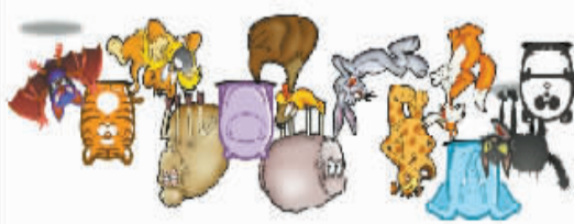
(一共 13 只动物, 兔子在从左至右第 6 个)

方格填字答案: 横向: 1. 福尔马林 2. 粉墨登场 3. 东来顺 4. 末代皇帝 5. 谷子地 6. 汶川 7. 爱屋及乌 8. 端午节 9. 苏永康 10. 和平里 11. 尚雯婕 12. 庞氏 13. 江南 14. 京华烟云 纵向: 一、粉丝 二、张爱玲 三、和氏璧 四、摩登时代 五、乌苏里江 六、东帝汶 七、南京 八、福美来 九、川端康成 十、冯小云 十一、林家铺子 十二、孙雯 十三、地铁 十四、婕妤 练眼神答案: 2 和 11、5 和 7、4 和 10