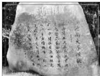
刻在石头上的校歌。（均据资料图片）