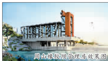
周山橡胶坝管理房效果图