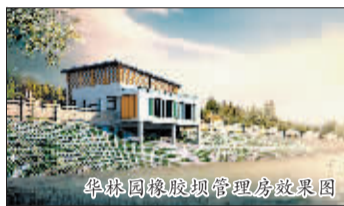
华林园橡胶坝管理房效果图