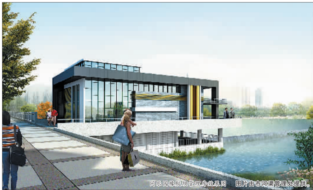
同乐园橡胶坝管理房效果图