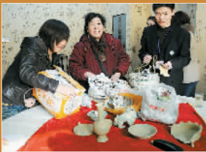
一下子带来这么多宝贝。