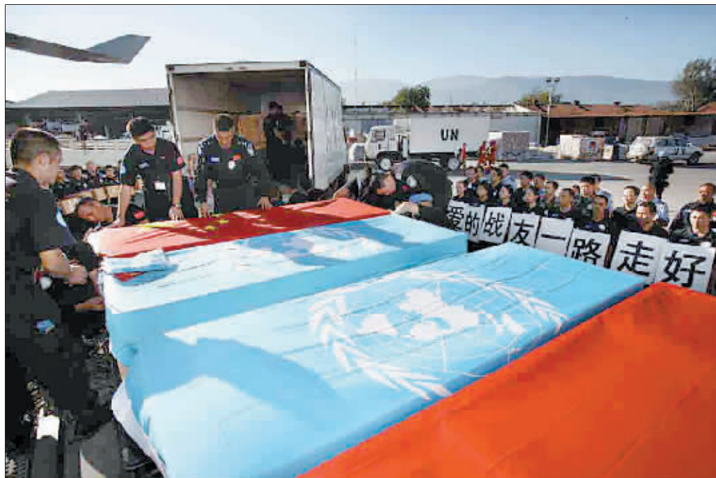
1月17日,中国南方航空公司的货运包机将从海地运送遇难中国维和人员的遗体回国。

当地时间1月17日上午,海地太子港机场。在战友们依依不舍的目光注视下,8名在地震中遇难的中国维和人员的灵柩被送上中国南方航空公司的一架包机,启程回国。