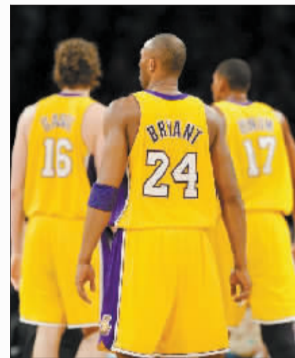
科比的手感不佳。