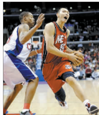
易建联受阻,网队一败涂地。

脆弱的防守令网队首节过后就落后了15分,次节他们把分差缩小至12分,可第三节过后又让快船队以88:66领先22分。胜利在望的快船队最后一节打得较为松懈,结果让网队在终场时把分差缩小到11分。