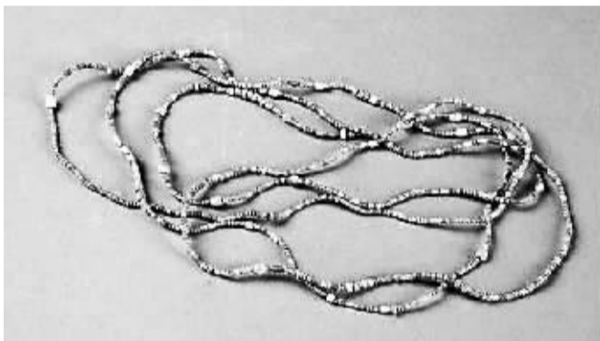
文物名称：绿松石串饰 时代：东周 尺寸：长130厘米 收藏单位：洛阳博物馆

自从洛阳发现这一宝物后，凡业界专家来洛，都要点名索看此物。其中有学者指出：我国历史上著名的和氏璧，就是用一块绿松石制成的，这说明绿松石类文物非常珍贵，也说明今人对绿松石的研究仍未有穷期。