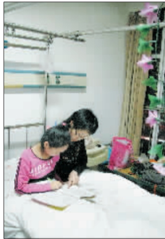
妈妈在病房里为芳芳补习功课。