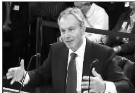
布莱尔出席伊战调查听证会

据悉,在当地时间1月12日海地发生里氏7.3级强烈地震后,海地政府出台了有关收养儿童的新规定。为了防止走私儿童活动,海地政府规定,任何海地儿童出境都必须得到海地总理让-马克斯·贝勒里夫的亲自授权。