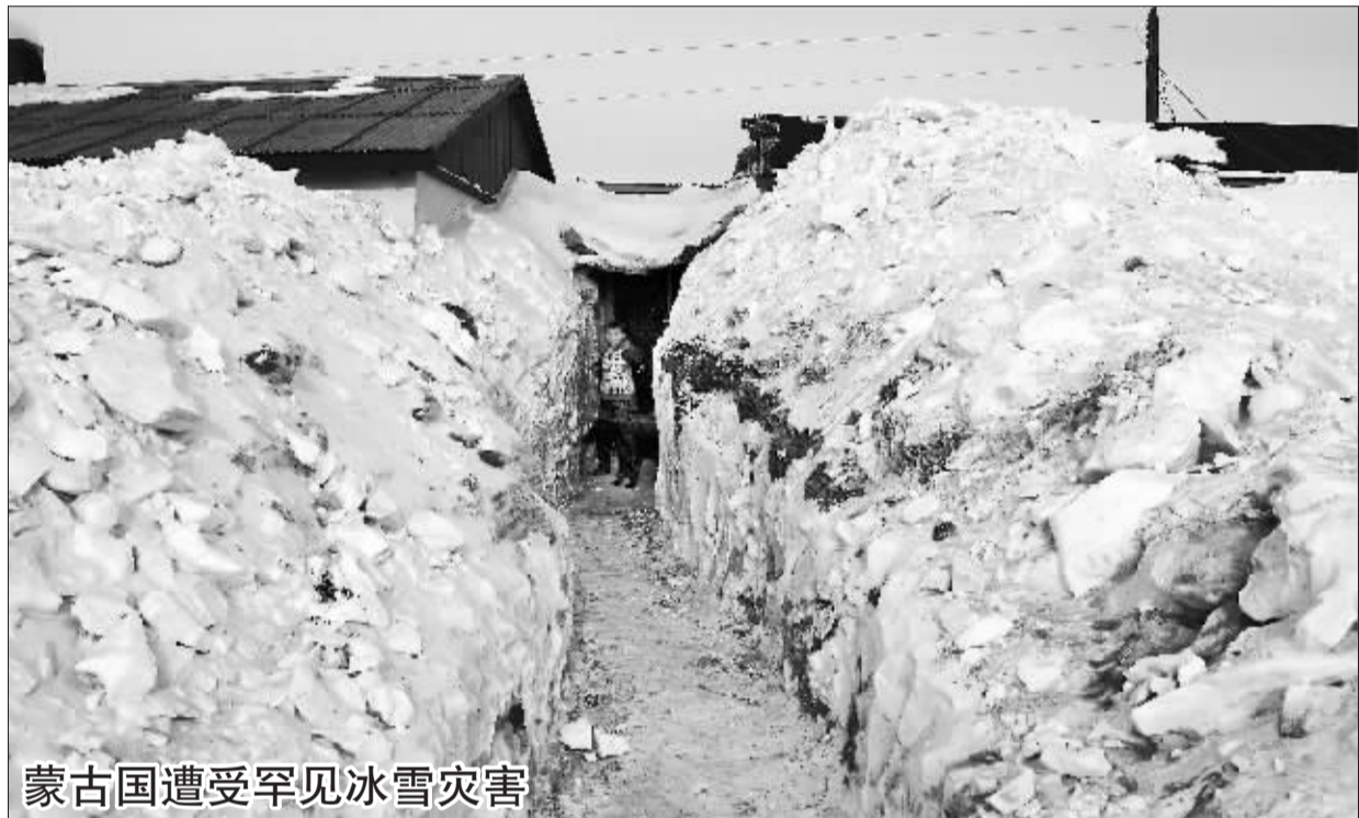
蒙古国遭受罕见冰雪灾害

这张1月29日发布的电视截图显示的是英国前首相托尼·布莱尔在英国首都伦敦出席公开听证会。当天,布莱尔在听证会上为伊拉克战争调查提供证词。听证会受到不少伊战受害者及其亲属关注,引来数以百计的示威者。