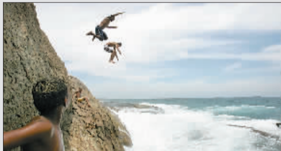
1月31日,几名儿童在巴西里约热内卢的海边跳水。