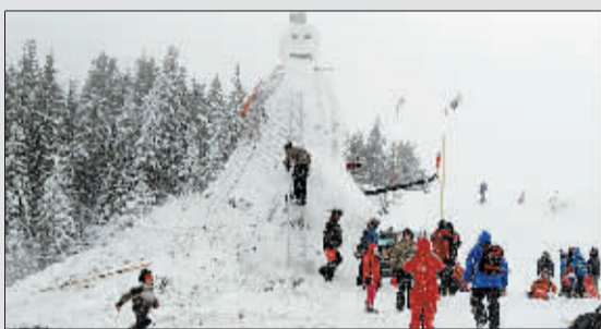
1月31日,在罗马尼亚的日乌谷地区,居民堆积大雪人。