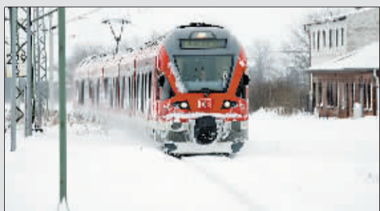
1月31日,一辆列车行驶在德国北部被大雪覆盖的铁道上。