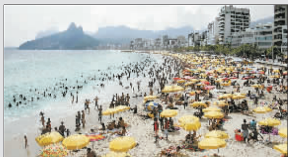
1月31日,人们在巴西里约热内卢的海滩休憩。