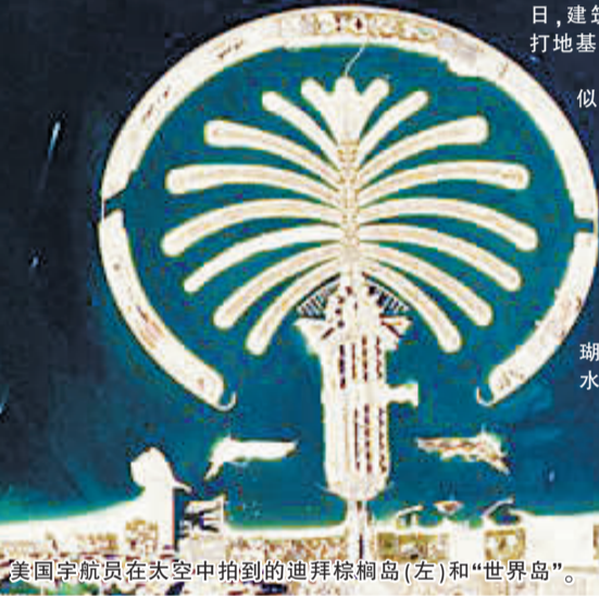
美国宇航员在太空中拍到的迪拜棕榈岛(左)和“世界岛”。