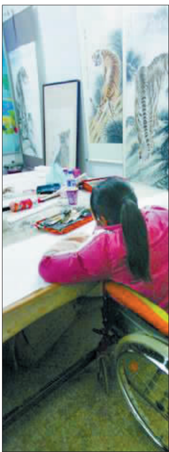
一名残疾画家正在作画。