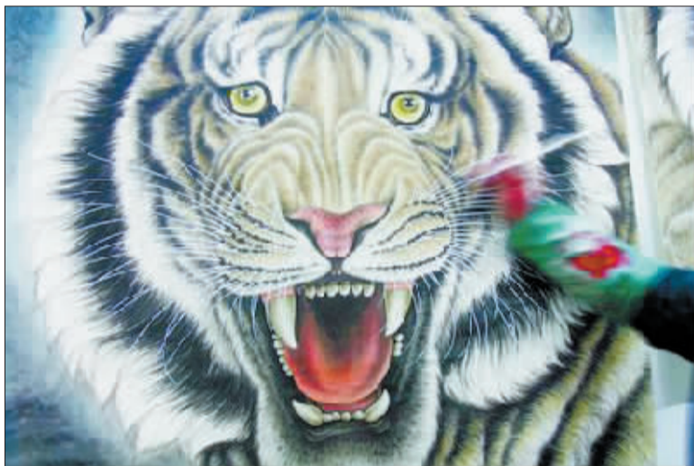
一名农民画家正在为虎头最后润色。