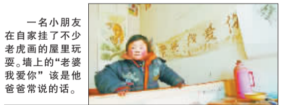
一名小朋友在自家挂了不少老虎画的屋里玩耍。墙上的“老婆我爱你”该是他爸爸常说的。