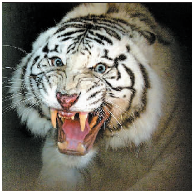
□记者 陈占举 曾宪平 文/图