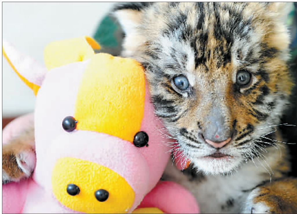
和“牛哥”亲亲热热合影。