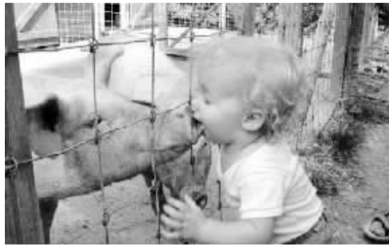
吼吼，这可是偶的初吻！