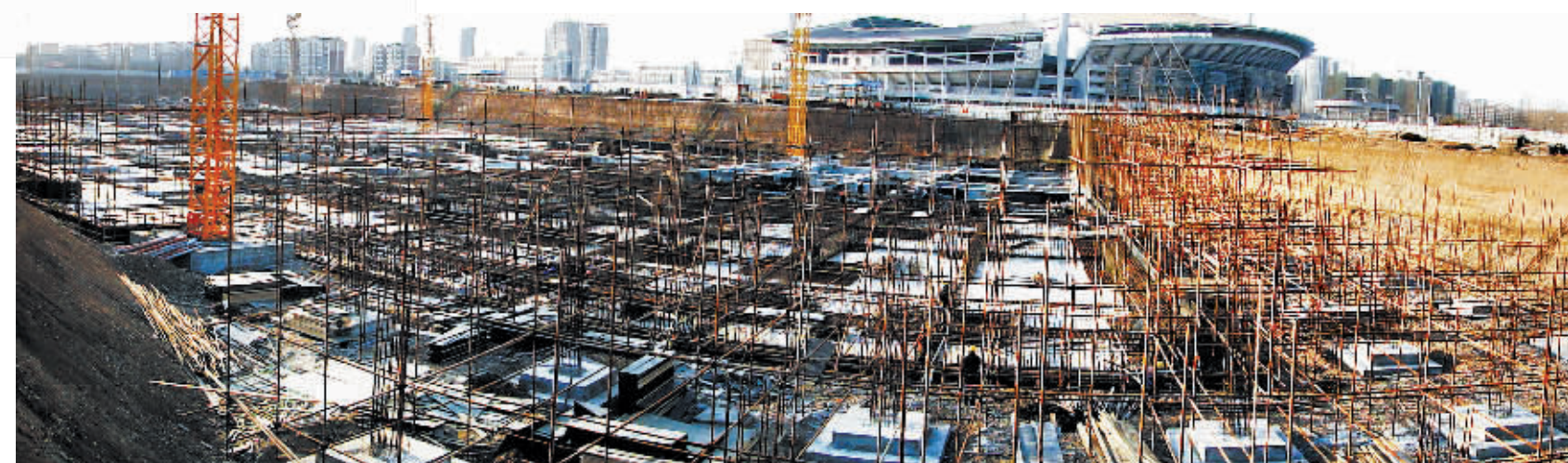
建设中的市人力资源市场暨会展中心