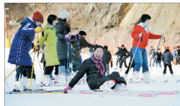
栾川伏牛山滑雪度假乐园