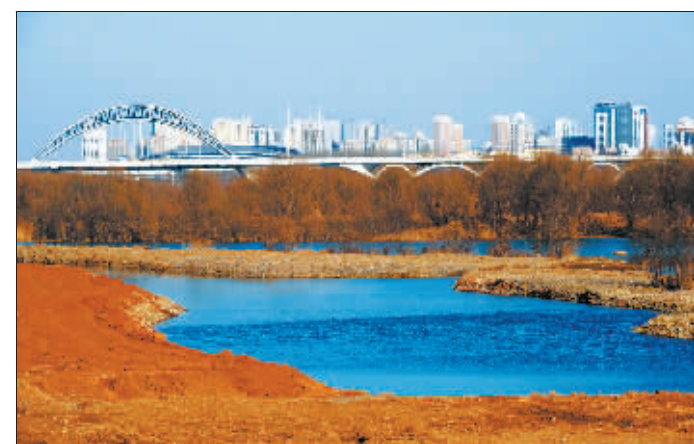
建设中的洛浦湿地公园