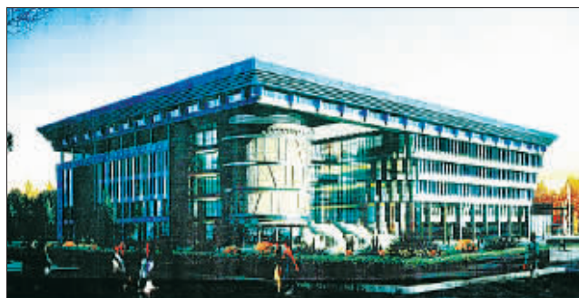
洛阳图书馆新馆效果图