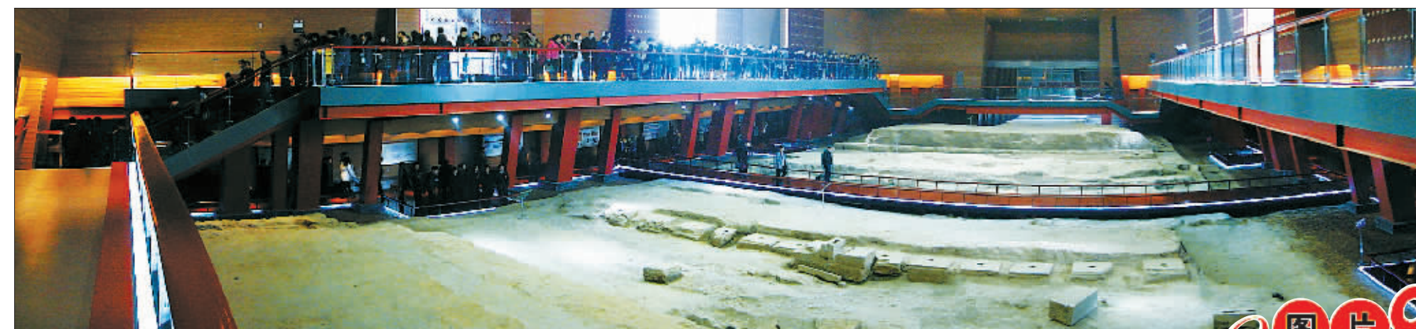
隋唐洛阳城定鼎门遗址博物馆