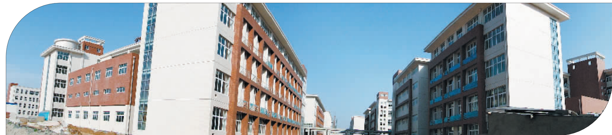
正在进行内部装修的洛一高新区校舍