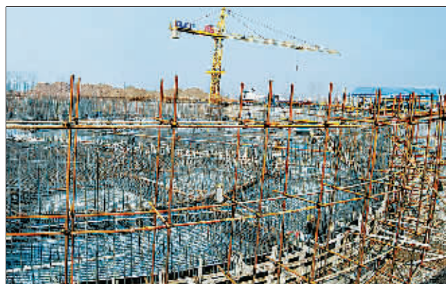
建设中的中国移动洛阳呼叫中心