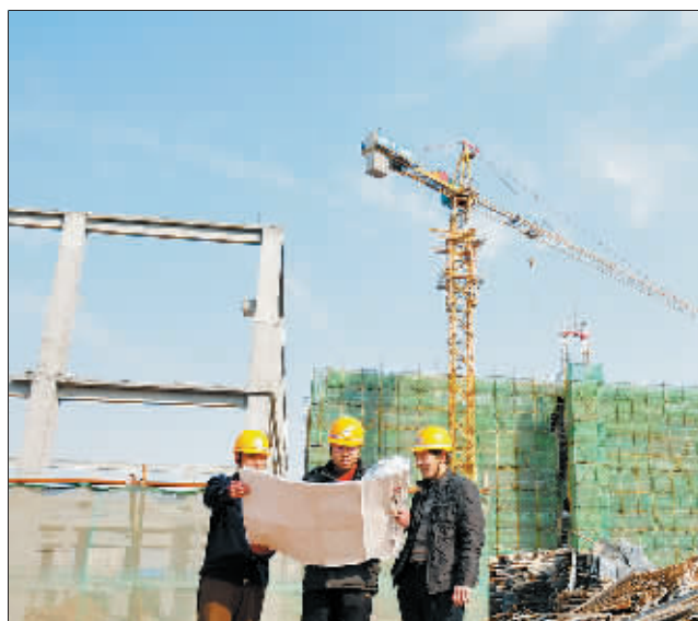
正在进行内部装修的洛阳新区龙康中学校舍