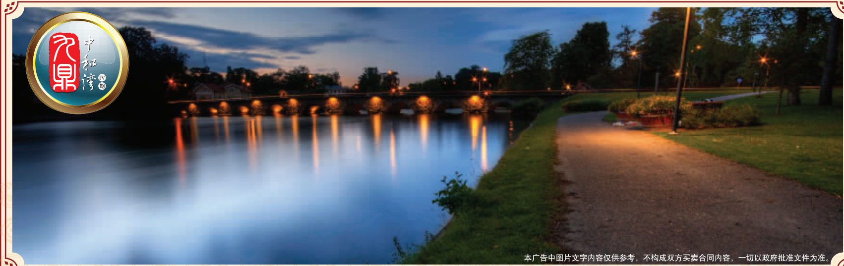
本广告中图片文字内容仅供参考,不构成双方买卖合同内容,一切以政府批准文件为准。