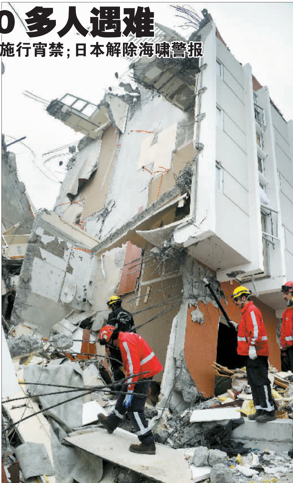
2月28日,救援人员在智利康塞普西翁一座被地震毁坏的大楼废墟里搜寻遇难者。

关田康雄虽然就海啸预报过度道歉,不过他认为,现阶段还不能说存在判断失误。他表示,气象厅是在海啸数据和多种模拟结果的基础上进行反复探讨,并在假定出现最坏情况的前提下发布的警报。