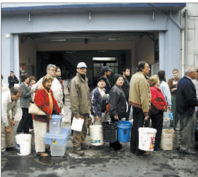
2月28日,在智利南部城市康塞普西翁,市民排起长队等待领取饮用水。