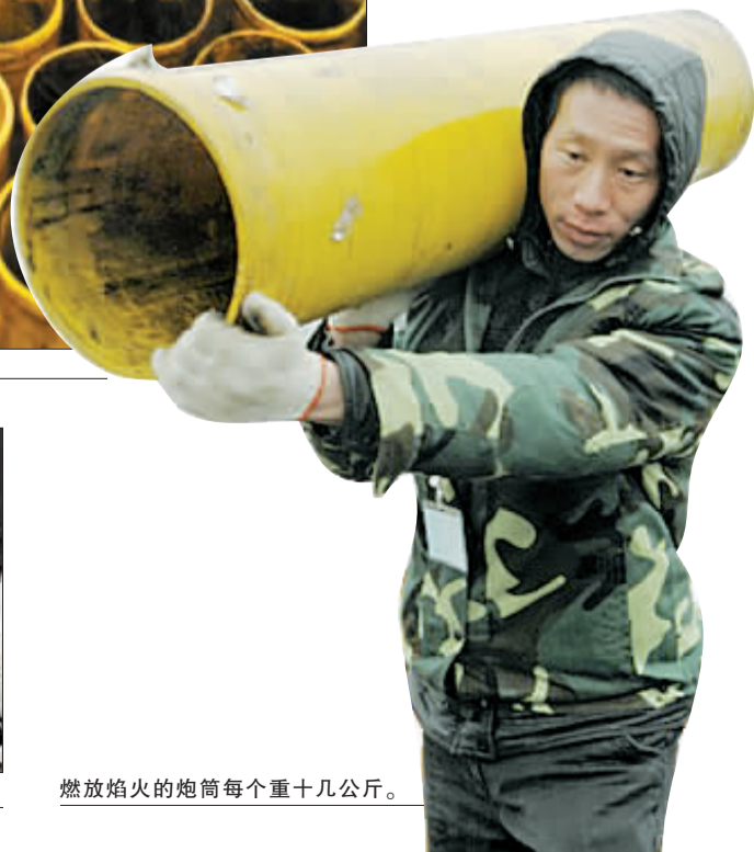
燃放焰火的炮筒每个重十几公斤。