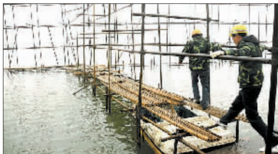
工人师傅在焰火字幕脚手架上忙碌。