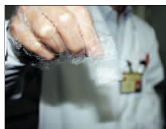
这包白色晶体经检测为冰毒与K粉的混合物。