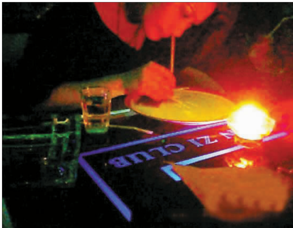
一名女孩在划拳输了后吸食K粉。

近日,记者在报料人阿康(化名)的带领下,来到位于韶关市浈江区亿华城市广场的皇朝天子会酒店,亲眼目睹了一众男女在K房吸毒的场景。