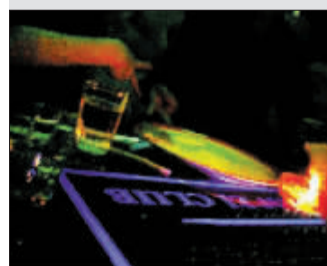
迷离的灯光下,吸K粉也通过“剪刀石头布”来划“道道”。