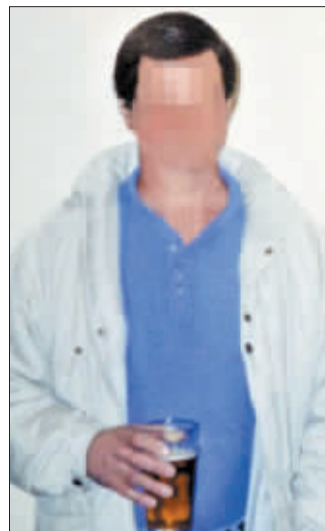
英《每日邮报》公布的“乱伦兽父”照片。

中国日报供本报特稿 据英国《每日电讯报》3月10日报道,英国一名56岁“兽父”毒打并强奸两个亲生女儿长达25年,迫使她们怀孕18次、生下9个孩子。为防止罪行败露,他先后搬家67次。10日,英国相关社会机构召开新闻发布会公开道歉,承认工作严重失职。