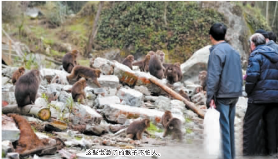
这些饿急了猴子不怕人。

近日，四川彭州银厂沟高山降了大雪后，五六十只猴子突然在一天早晨下山，闯进了它们以前极少涉足的人类聚居地，捣掉房瓦、掀翻锅盖、打烂窗户，目的只有一个——向人类讨食。对于突然造访的猴群，当地居民觉得它们可怜：要不是饿了，猴不会来骚扰人。但如若纵容它们产生依赖，也是当地居民的一大隐忧。随后，网帖《彭州银厂沟猴群饥寒交迫》迅速热传，引发广泛关注。