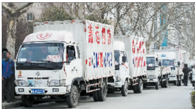
九都路涧河桥东，搬家公司的货车排成了长队。