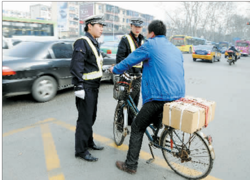
中州路与王城大道交叉口,一个闯红灯的男子被执勤交警拦下。