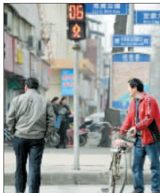
中州路与定鼎路交叉口,两个男子闯红灯。

5. 雨天行走要调整好雨帽、雨伞的角度,看清来往车辆,小心通行,要警惕因雨天路滑,车辆难以刹住而导致意外;夜间过马路要尽量选择有灯光的地方,不要在路中间停留,严禁在车流中穿行,以防因车辆灯照盲区而发生危险。