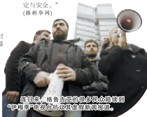
连日来，格鲁吉亚的很多民众陆续到“伊梅季”电视台抗议其虚假新闻报道。