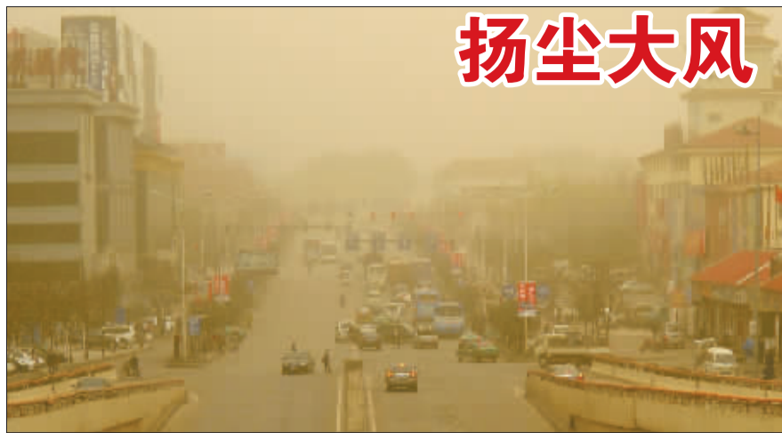
20日,沙尘来袭,定鼎路一带能见度降低,灰蒙蒙的一片。