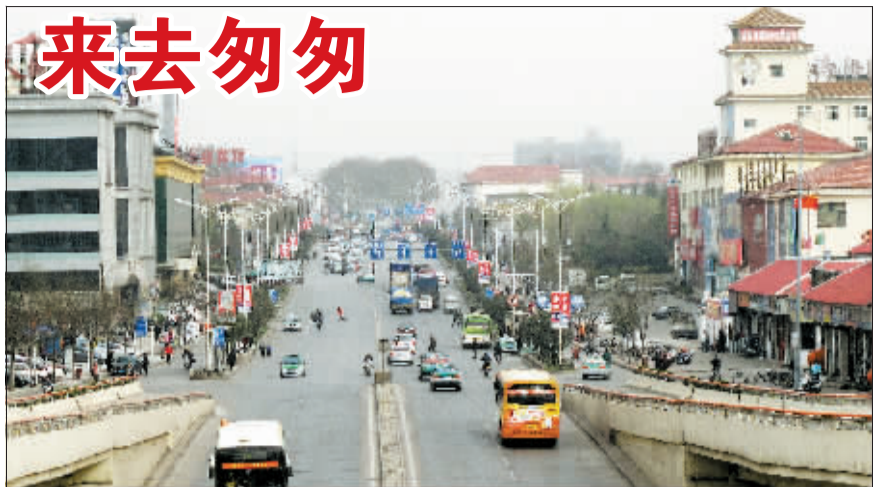
21日天气放晴后的定鼎路。