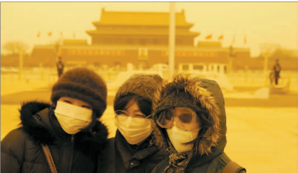
3月20日,几名游客在天安门广场拍照。当日,北京出现沙尘天气,刮起5级至6级大风。