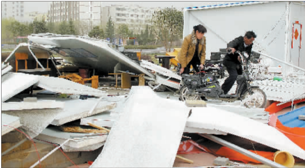
汝阳县遭遇1968年以来风沙最大的天气,好几处大型广告牌和板房被大风刮坏。

3月中旬开始,我国进入沙尘天气多发期。在国家气象台预测的北方地区接下来的几次沙尘天气过程中,包括洛阳在内的河南大部分地区还可能受到影响。市气象台专家表示,沙尘天气出现时,人容易出现流鼻涕、流泪、咳嗽、咳痰等刺激症状和过敏反应,遇到沙尘天气,请及时关闭门窗,保持室内湿度;要多喝水,以增强对环境的适应能力;小孩和老人应尽量避免出门,出门时应注意穿戴防尘的衣服、手套、纱巾、眼镜等,不要戴隐形眼镜,并要避免在广告牌下、树下行走或逗留;行人和司机要避免因视线不清或心情急躁而加速、抢道。