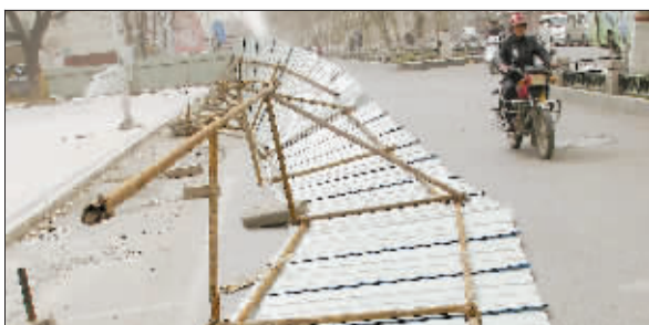
吹倒。中州路一工地护栏被大风吹倒。