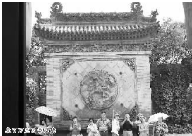
康百万庄园影壁墙

有外地专家研究洛阳民居,说:“洛阳一大怪,房子半边盖。”什么意思呢?专家是这样解读的:假定一个坐北朝南三开间院落,北面为上房,洛阳人俗称“大屋”,地势要比院子高出四五级台阶,这便是洛阳民居中最尊贵的建筑了。其次是厨房和厦子(厢房),分列于院子的东西两面。洛阳民居的特点,怪就怪在厨房和厦子上。其他的房屋都是“人”字形屋脊,只有这两种房屋是半“人”字形屋脊,院墙向院内倾斜,很像一间瓦房沿