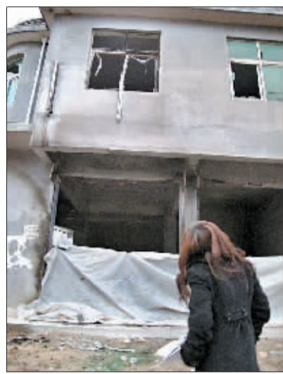
“只听见轰隆一声响,我跑出来一看,对面门面房的卷帘门、窗户全没了……”说起昨日中午看到的一幕,嵩县车村镇车村村的

许多居民还心有余悸。 昨日13时20分前后,嵩县车村镇车村一幢二层民房内突然发生爆炸,造成房屋多处受损。所幸的是,爆炸发生时楼内无人。 爆炸发生后,记者驱车火速赶往现场。 这幢发生爆炸的二层民房处在该村东北角,一楼是门面房,二楼是居民住房。从外面看,民房已面目全非:一楼两扇金属卷帘门已经不见(如图),爆炸形成的强大冲击波震碎了二楼的窗户玻璃及室外多处下水管道。记者看到,民房的数面墙已变成黑色。在该楼附近,空气中弥漫着浓烈的火药味。 爆炸发生时,许多村民都听到了巨响。这栋民房附近的住户们描述:“爆炸发生时,感觉自家的窗户玻璃都在颤动,就像有小孩在窗户外放了个‘春雷炮’。” 在现场勘察情况的车村镇派出所所长李会民说,爆炸发生时,这幢民房上下两层都没有人,所以事故并未造成人员伤亡。 据房屋主人介绍,这幢房屋在两年前已经租给一家矿业公司用于存放设备、原料。据了解,该矿业公司证件不全,公司负责人因涉嫌非法储存爆炸物已被处理,但发生爆炸的民房内存放的东西一直没有被完全清理。 民警初步判断,爆炸有可能是该公司之前存放在楼内的炸药引起的。目前,事故原因还在进一步调查中。