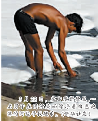
3月22日,在印度新德里,一名男子在因污染而漂浮着白色泡沫的河边寻找硬币。