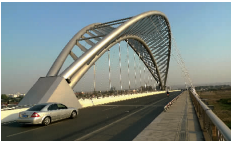
洛阳新区瀛洲路——瀛洲桥

大城市框架”和“通过5年或更长时间的努力,把洛南建设成为充满现代化气息的新城区”的城市发展战略。