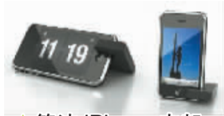
简洁 iPhone 支架

这款漂亮 iPhone 支架的设计十分简洁。设计师利用了比 iPhone 略宽的支架卡口,让 iPhone 凭借摩擦力,自己站立、固定在桌面上。