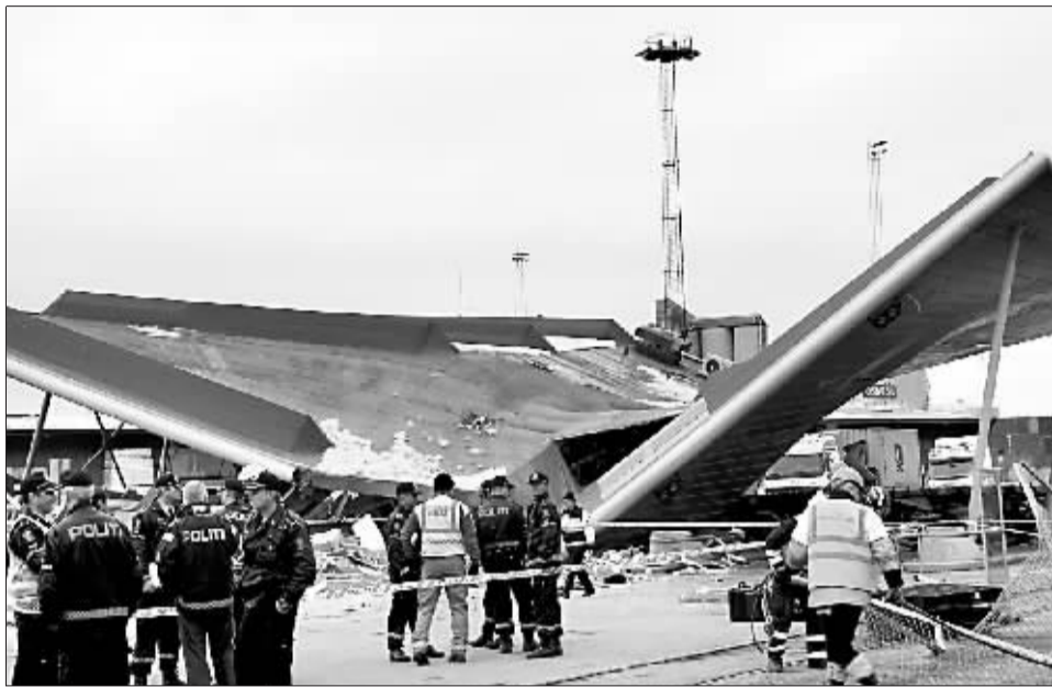
警察和救援人员在列车脱轨事故现场忙碌。