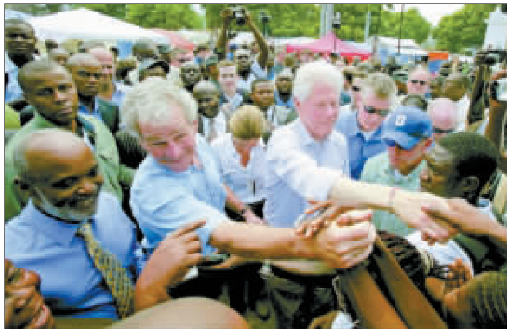
布什(左二)与克林顿(左三)与海地灾民握手。

据新华网消息 据英国《卫报》和美国广播公司(BBC)25日报道,美国两位前总统布什和克林顿 24 日首次作为现任总统奥巴马的特使联手访问海地,慰问地震灾民,帮助海地筹集解决灾后重建事宜。但期间却发生了一起令人关注的事件,布什被拍到和灾民握手后立即在克林顿身上擦拭(右图),显然是嫌人家手脏。 布什抹手的整个过程被 BBC 记者拍了下来,视频中布什和克林