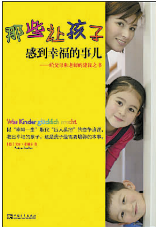
《那些让孩子感到幸福的事儿》 作者:安东·布赫尔(德) 出版社:中国青年出版社

孩子有权获得幸福,这一点已是全世界承认的公理。1959年通过的联合国《儿童权利宣言》是联合国历史上加入国家最多的国际公约。大会发布这一《儿童权利宣言》,以期望儿童能有幸福的童年,为其自身和社会的利益而得享宣言中所说明的各项权利和自由,并号召所有父母以及各自愿组织、地方当局和各国政府确认这些权利,采取立法和其他措施力求这