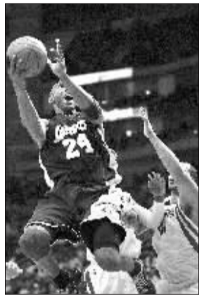
3月27日，湖人队球员科比·布莱恩特（左）在比赛中上篮。当日，在NBA常规赛中，休斯敦火箭队主场以101:109不敌洛杉矶湖人队。

女排的换帅，既突然，又在人们预料之中。只是回想去年假模假式的选帅过程，更像是一出闹剧。蔡斌连泰国队都敢输，谁想保也保不住了。因为很多时候一个教练的成功不在于你有多高的水平，而在于你能不能得到队员的认可。接替蔡斌的王宝泉终于有了“出头之日”，尽管这纸任命书“迟到”了一年，但现在距离伦敦奥运会还有两年时间，以王宝泉创造津门神话的经历，他或许有能力带领中国女排走出低谷。“哪怕献出自己的生命，我也要重塑中国女排的辉煌。”王宝泉这一番感人的上任宣言，令人钦佩。