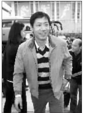
3月28日，中国女排主教练王宝泉率队抵达福建漳州。当日，新一届中国女子排球队在新任主教练王宝泉的率领下，抵达福建漳州女排训练基地，开始2010年首次封闭式训练。