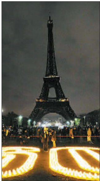
巴黎埃菲尔铁塔的景观灯被关闭。