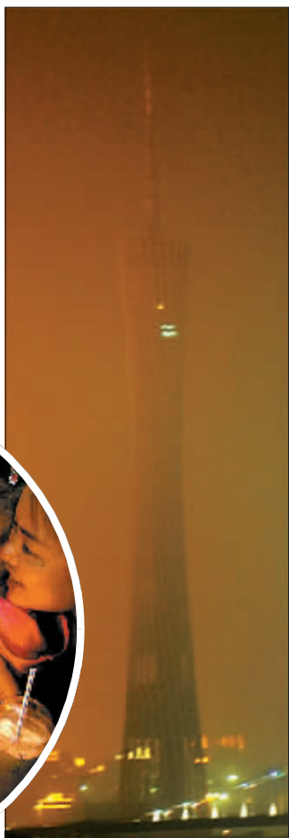
熄灯后的广州电视观光塔。