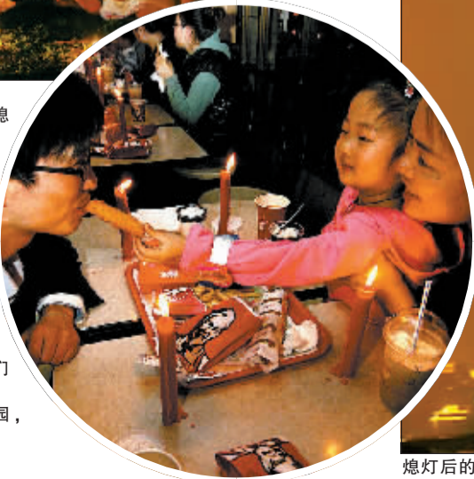
图① 北京故宫博物院熄灯前后的对比。 图② 布宜诺斯艾利斯市中心方尖碑熄灯前和熄灯后的景色。 图③ 莫斯科大学主楼熄灯前和熄灯后的景色。 图④ 成都市民手捧点燃的蜡烛。 图⑤ 在塞浦路斯首都尼科西亚的总统府，学生们参加“地球一小时”活动。 图⑥ 在新加坡滨海公园，儿童点燃蜡烛。