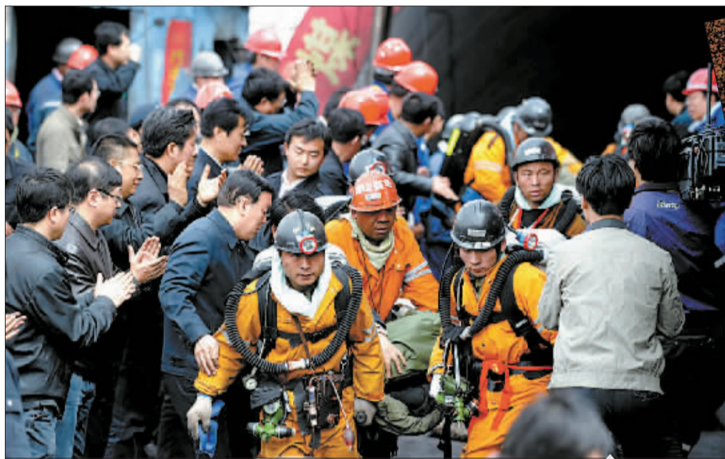
救援人员将获救矿工抬出井口。