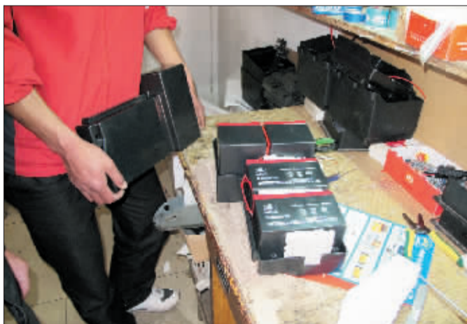
—电动车维修点工作人员正在装配电池。

电动车电池的充放电循环次数约300次，给电池充电时，比较合理的做法是在电池电量放出50%至70%时进行充电。这样既不影响电池的蓄电量，延长电池使用寿命，同时也不会给充电器造成过大负担，导致充电器损坏或性能下降。如果用户的电动车长期放置家中不用，电池应每隔20天至30天充电一次，以防止亏电。