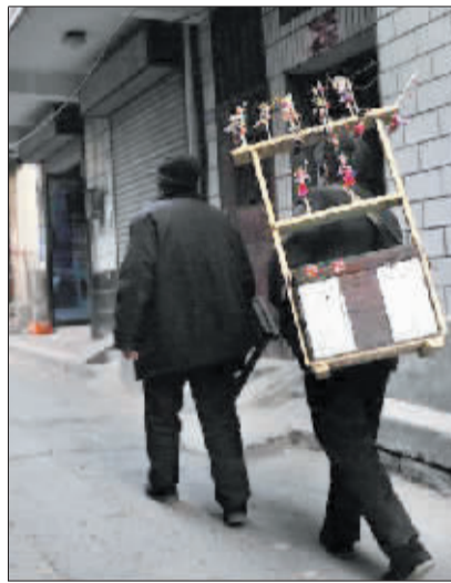
爷俩又开始走街串巷叫卖面人。