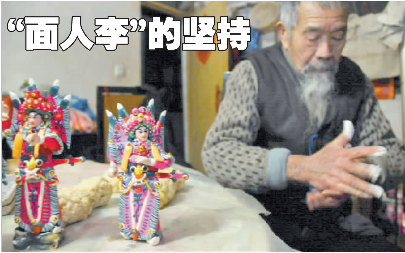
在老人眼里,捏面人是自己一生的事业,他选择坚持。