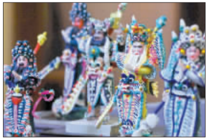
捏出的面人惟妙惟肖。