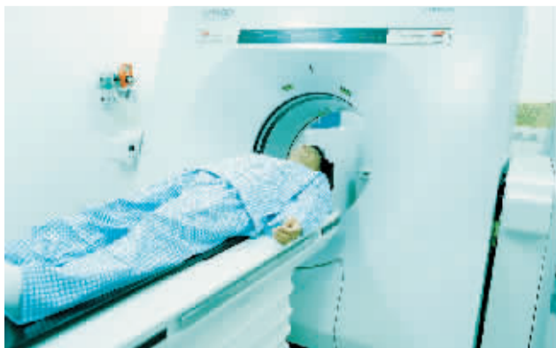
纳米超导技术,强弓海洋之星二代男性功能康复系统、韩国