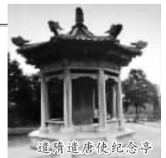
遣隋遣唐使纪念馆

古时,洛阳通往日本的道路维护较好,但因朝代变迁,各代线路略有差异。东汉安帝在位时,日本国使者来洛阳,行走的路线是:从日本渡海,先到如今朝鲜的平壤附近,然后经今丹东、辽阳、北京、涿州、邢台、邯郸、临漳、武陟,抵达洛阳。